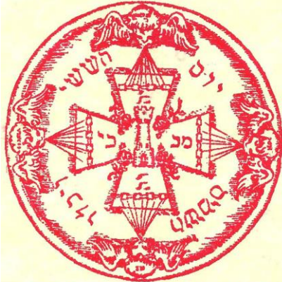
Το σιγίλλιο του Αληθούς και Χρυσού R+C

Η Εταιρία των «Αγνώστων Φιλοσόφων» ή αλλιώς «Εταιρία των Κοσμοπολιτών» και οι «Εκλεκτοί Κοέν» ( Τέκτονες Ιππότες Εκλεκτοί Ιερείς του Σύμπαντος ) του Martines de Pasqually διατήρησαν τις Ροδοσταυρικές δοξασίες και από αυτές τις οργανώσεις προήλθε αργότερα ο «Μαρτινισμός». Έτσι συνοπτικά, ο Παραδοσιακός Τεκτονισμός και ο Μαρτινισμός διατηρούν τις Ροδοσταυρικές Δοξασίες.